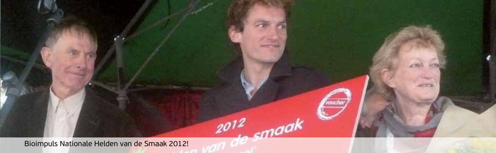
Bioimpuls Nationale Helden van de Smaak 2012!

ook stikstofefficiëntie en een goede kiemrust tijdens de bewaring zijn belangrijk. En om te voorkomen dat de resistente rassen lang aan phytophthorasporen worden blootgesteld en tot doorbraak van resistenties kunnen leiden, is een zekere mate van vroegheid in knolvulling en afrijping een belangrijke eigenschap (minimaal een 7).