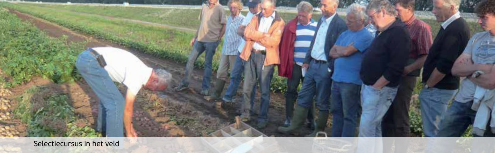
Selectie cursus in het veld