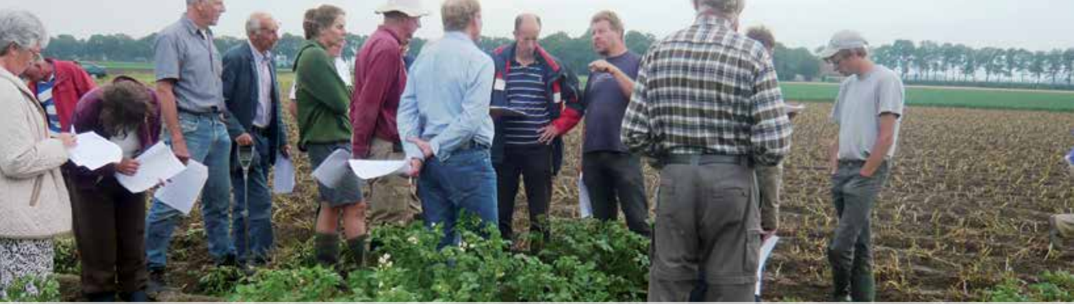
Veldbezigting met telers