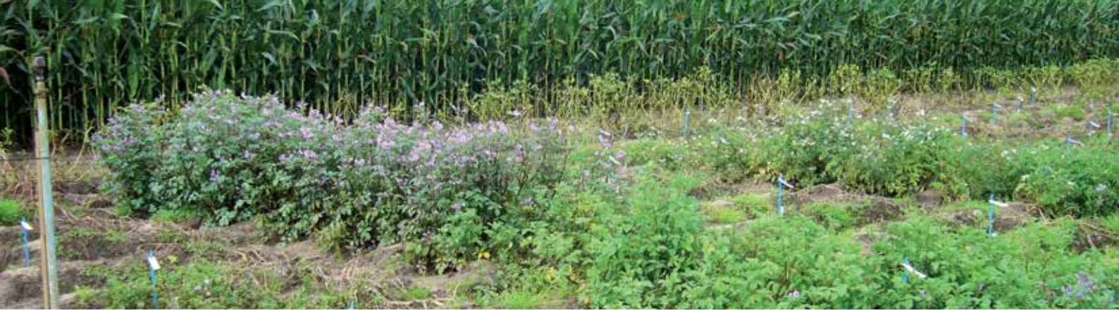
Wagenings proefveld met wilde aardappelsoorten