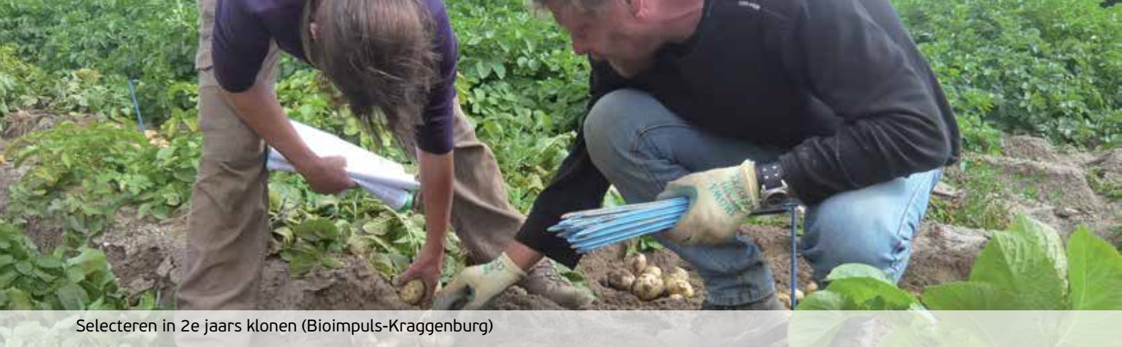
Selecteren in 2e jaars klonen (Bioimpuls-Kraggenburg)